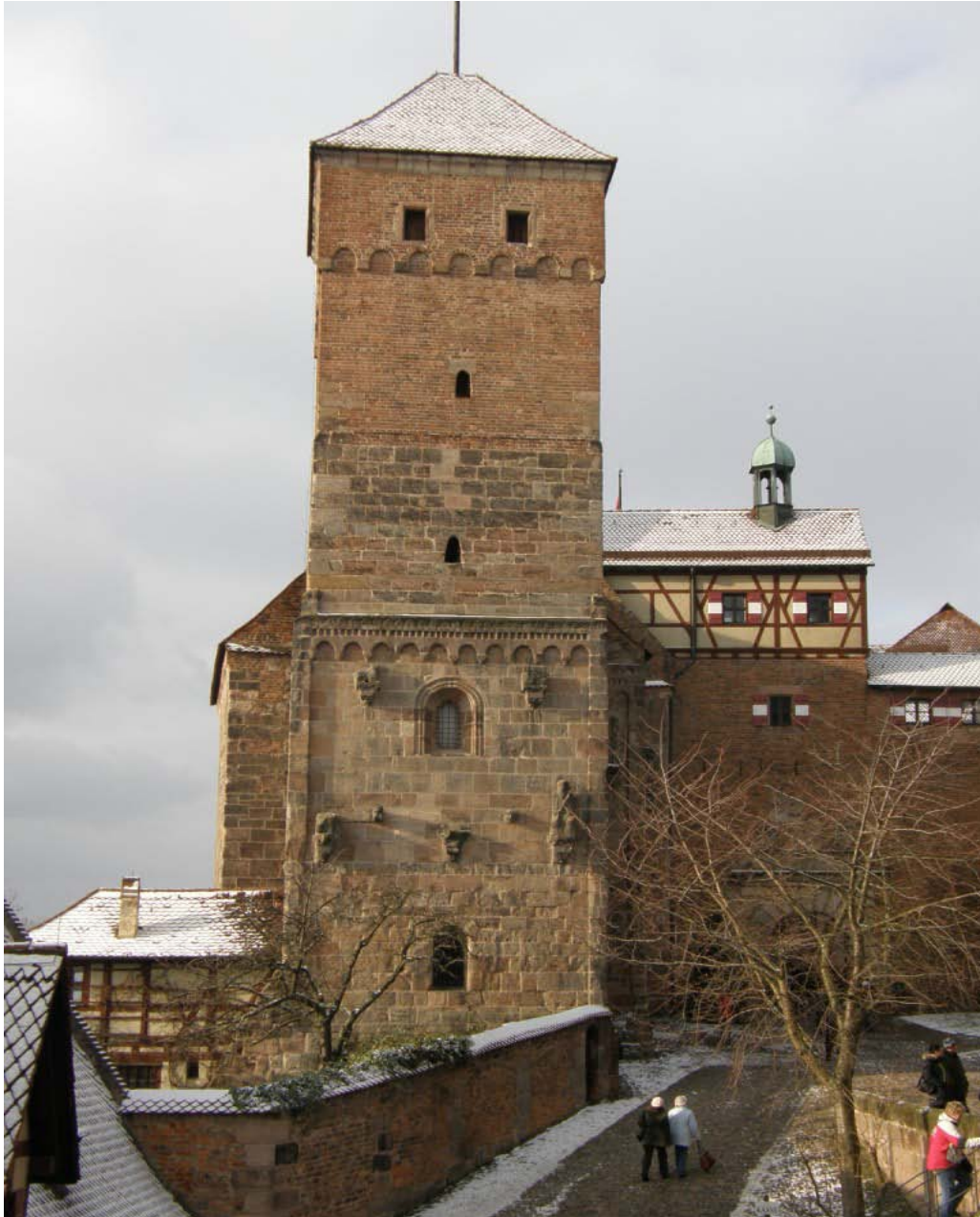
Winterlicher „Heidenturm“ der Nürnberger Kaiserburg